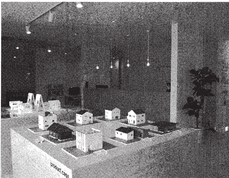
開設した「casa MIKAWA MINAMI」

営業拠点「casa MIKAWA MINAMI(カーサ三河南)」は、西尾市矢曽根町赤地の生花店跡地に居抜きで開設した。敷地面積は約600平方メートル。事務所と倉庫で構成す